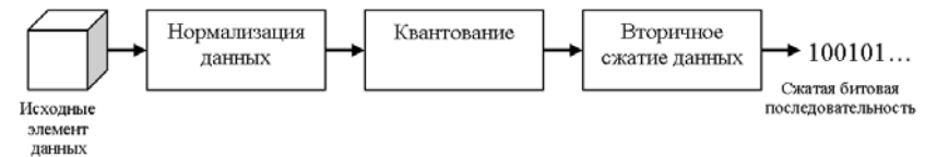
Рис. 1. Обобщенная последовательность этапов обработки данных в задачах компрессии.

Теоретическая возможность создания универсального инструментария для построения кодеков по схеме, приведенной на рис. 1 рассмотрена в [1].